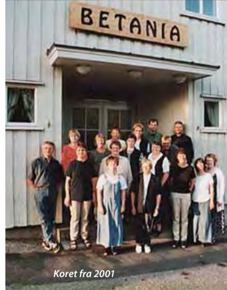
Koret fra 2001